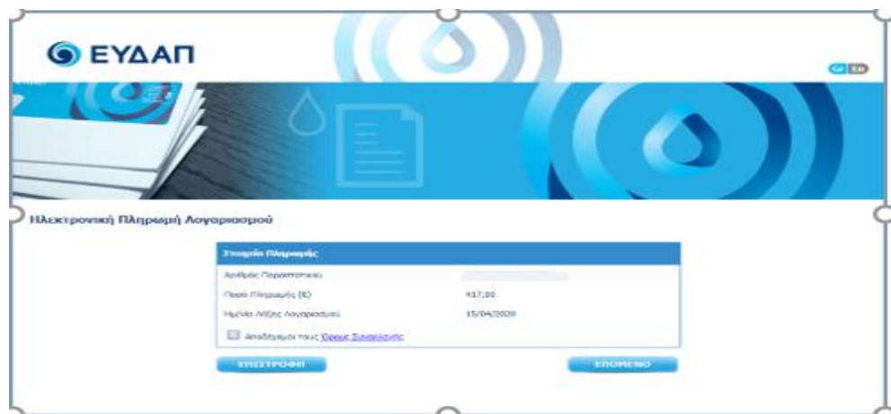
Εικόνα 5 Ηλεκτρονική Πληρωμή Λογαριασμού

α. πατήστε πάνω στο σχήμα της κάρτας και θα εμφανιστεί η εικόνα 5. Επιλέξτε Αποδέχομαι τους Όρους Συναλλαγής