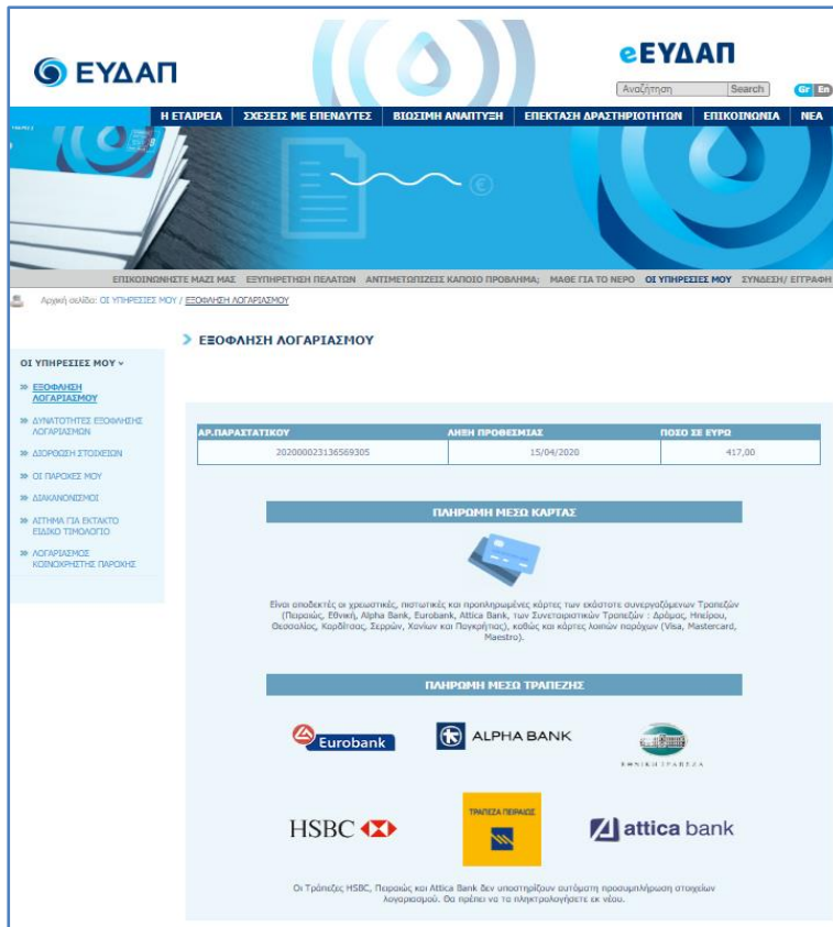
Εικόνα 4 Επιλογή πληρωμής για την εξόφληση του λογαριασμού